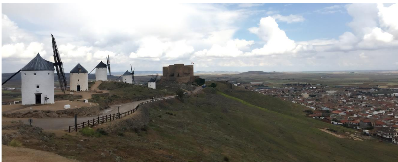
Figura 1. Castillo, molinos y paisaje circundante en Consuegra

En la mencionada tesis doctoral se recoge un centenar de fortificaciones o castillos, donde se critica que en dicho listado existan algunos castillos en ruina, lo que es poco presentable para ser ofrecido como recurso turístico. Hemos querido unir dicha información con la ofrecida en la página web de la Junta de Comunidades de Castilla-La Mancha referida a medio centenar de castillos, donde una mínima parte están en ruina ( https://www.turismocastillalamancha.es/patrimonio/castillos/ ), en la misma se aporta información referida a la visita, a los alrededores y dónde dormir o comer. El motivo fundamental es poder localizar los castillos que pueden tener interés turístico, debido a su buen estado, dentro del conjunto del Patrimonio Territorial a partir de las distintas comarcas geográficas. Lo que demuestra que nuestro objetivo es analizar paisajes dentro de cada comarca donde pueden aparecer distintos elementos, como es el caso de Consuegra que junto al castillo y los molinos une un paisaje humanizado o habitat (Figura 1).